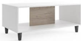
Stolik B10 100/50/55