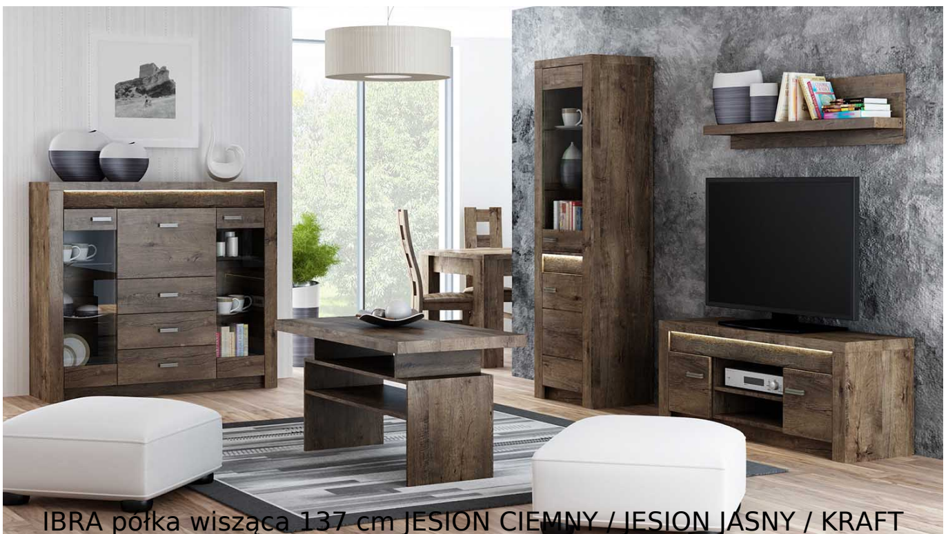
IBRA półka wisząca 137 cm JESION CIEMNY / JESION JASNY / KRAFT BIAŁY

Półka wisząca 2-drzwiowa o szerokości 137 cm należąca do systemu IBRA. Zaletą systemu IBRA jest fakt posiadania sporej liczby elementów, które wchodzi w jego skład. Meble wykonane z wysokiej jakości płyty laminowanej o grubości 16 mm. Blaty pogrubione do 48 mm. Widoczna oraz wyczuwalna faktura drewna. Obrzeża oklejone ABS, odporne na wilgoć oraz ścieranie.