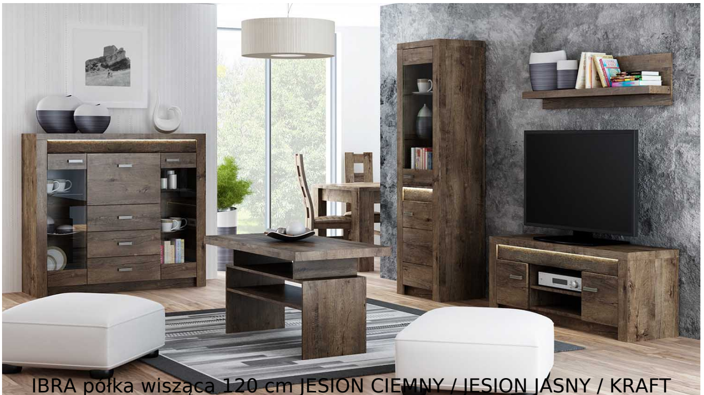
IBRA półka wisząca 120 cm JESION CIEMNY / JESION JASNY / KRAFT BIAŁY

Półka wisząca o szerokości 120 cm należąca do systemu IBRA. Zaletą systemu IBRA jest fakt posiadania sporej liczby elementów, które wchodzi w jego skład. Meble wykonane z wysokiej jakości płyty laminowanej o grubości 16 mm. Blaty pogrubione do 48 mm. Widoczna oraz wyczuwalna faktura drewna. Obrzeża oklejone ABS, odporne na wilgoć oraz ścieranie. Szuflady na prowadnicach kulkowych. Całość zdobią metalowe uchwyty. Meble pakowane w paczki, do samodzielnego montażu. Do kompletu dołączona przejrzysta instrukcja montażu. Produkt w 100% polski.