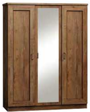
T15 135x57x190 cm