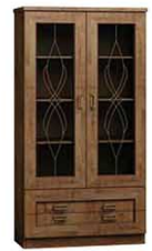
T8 90x44x190 cm opcja pełny front