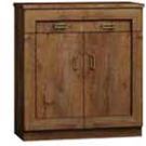
T2 90x44x110 cm