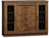
T14 140x44x110 cm opcja pełny front