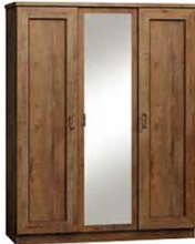
T15 135x57x190 cm