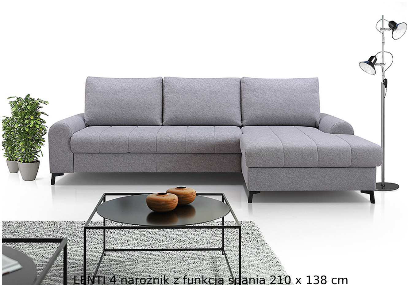
LENTI 4 narożnik z funkcją spania 210 x 138 cm