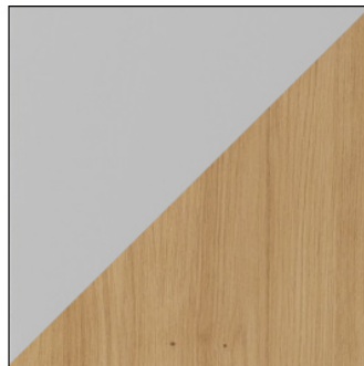
JASNY SZARY / ARTISAN