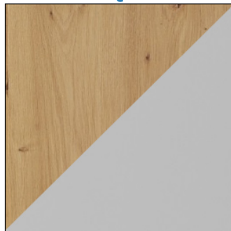
ARTISAN / JASNY SZARY