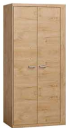
N1 102x57,5x200,5 cm opcja trzech półek opcja przycisk