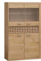
N5 102x40,5x159,5 cm opcja LED blat opcja LED półki