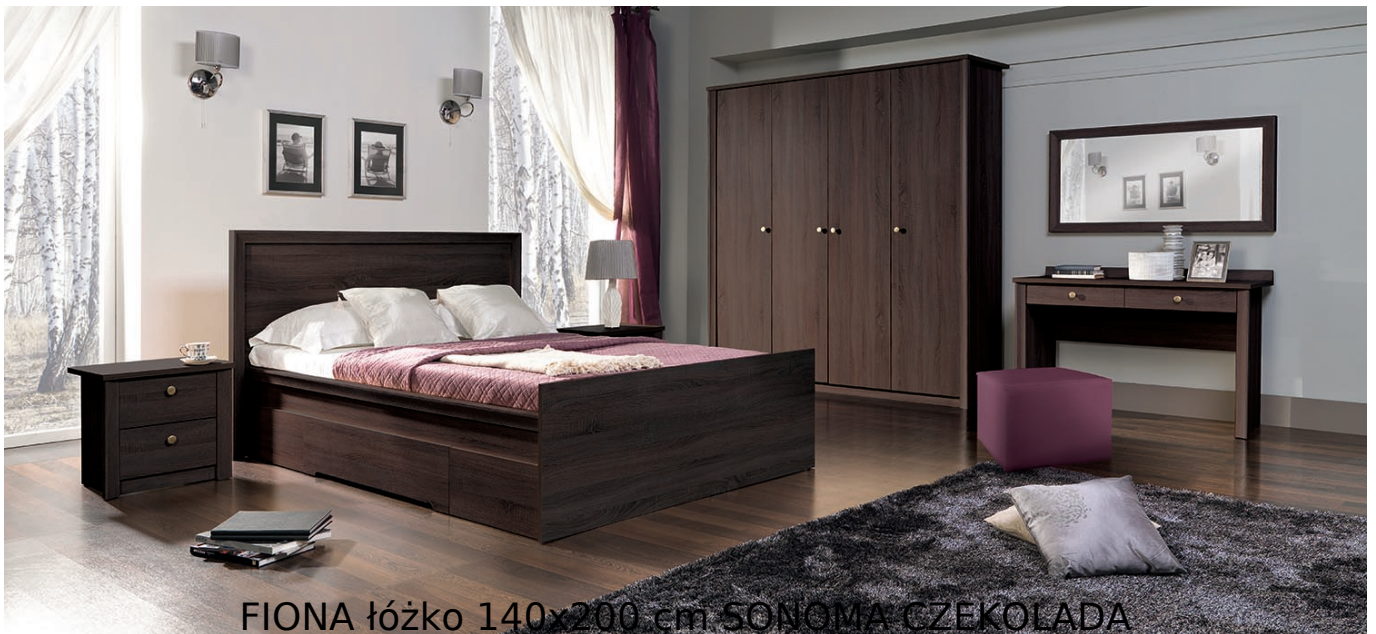
FIONA łóżko 140x200 cm SONOMA CZEKOLADA

Łóżko 2-osobowe z 2 szufladami należące do kolekcji Fiona. Kolekcja mebli do salonu lub sypialni w kolorystyce dąb sonoma lub sonoma czekolada. Funkcjonalne rozwiązania zapewniają wygodne i komfortowe miejsce do odpoczynku. Meble wykonane z wysokiej jakości płyty, korpus okleiony obrzeżem ABS. Meble pakowane w paczki, do samodzielnego montażu. Do kompletu dołączona przejrzysta instrukcja montażu. Produkt w 100% polski.