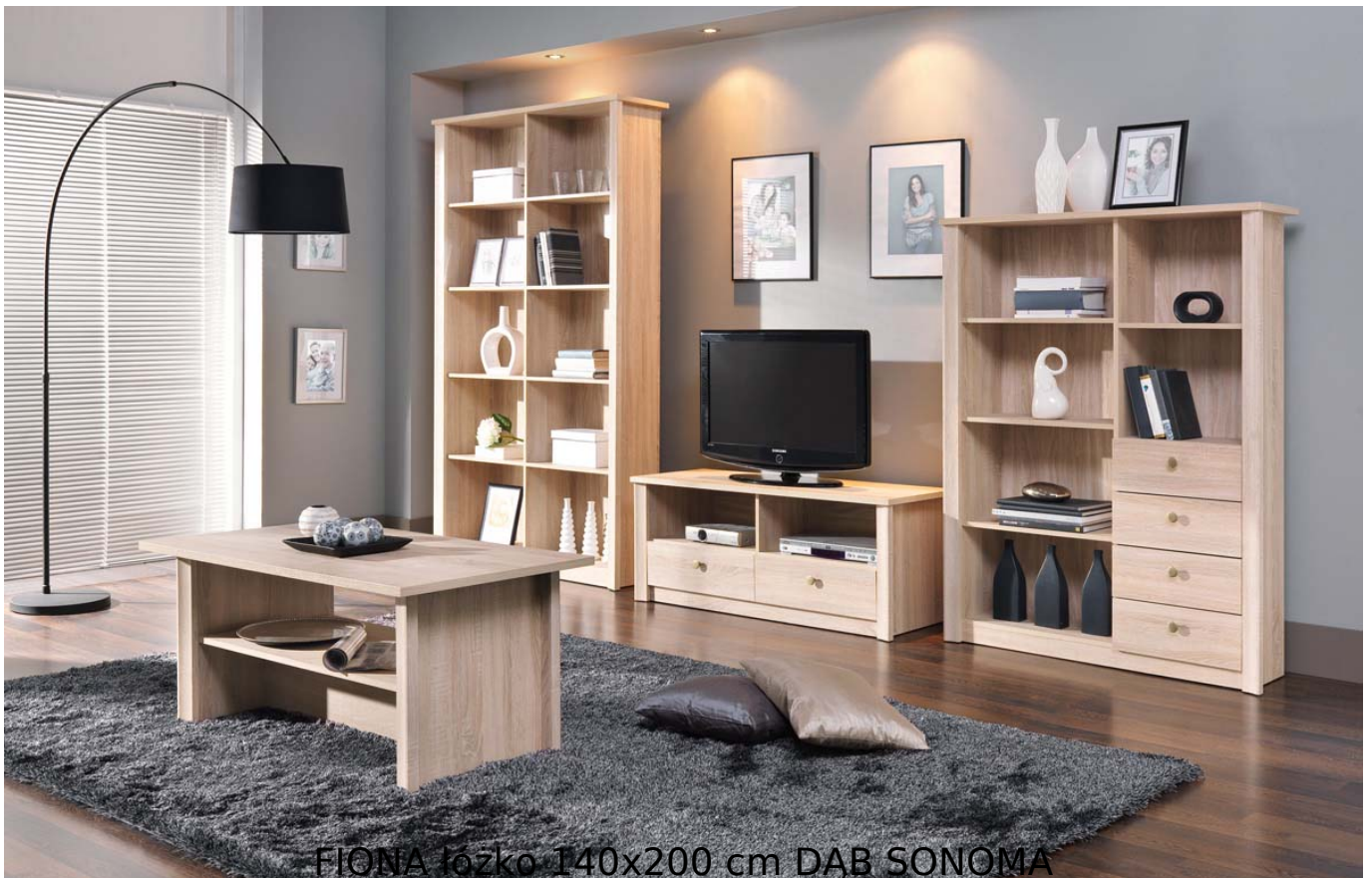
FIONA łóżko 140x200 cm DĄB SONOMA

Łóżko 2-osobowe z 2 szufladami należące do kolekcji Fiona. Kolekcja mebli do salonu lub sypialni w kolorystyce dąb sonoma lub sonoma czekolada. Funkcjonalne rozwiązania zapewniają wygodne i komfortowe miejsce do odpoczynku. Meble wykonane z wysokiej jakości płyty, korpus oklejony obrzeżem ABS. Meble pakowane w paczki, do samodzielnego montażu. Do kompletu dołączona przejrzysta instrukcja montażu. Produkt w 100% polski.