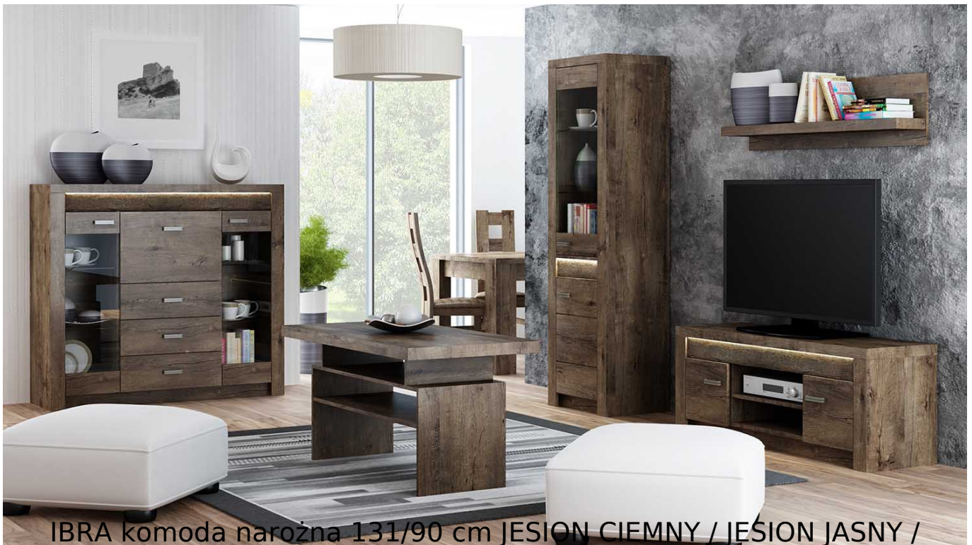
IBRA komoda narożna 131/90 cm JESION CIEMNY / JESION JASNY / KRAFT BIAŁY

Komoda narożna 3-drzwiowa o szerokości 131/90 cm należąca do systemu IBRA. Możliwość dokupienia oświetlenia LED blat do listwy ozdobnej. Zaletą systemu IBRA jest fakt posiadania sporej liczby elementów, które wchodzi w jego skład. Meble wykonane z wysokiej jakości płyty laminowanej o grubości 16 mm. Blaty pogrubione do 48 mm. Widoczna oraz wyczuwalna faktura drewna. Obrzeża oklejone ABS, odporne na wilgoć oraz ścieranie. Szuflady na prowadnicach kulkowych. Całość zdobią metalowe uchwyty. Meble pakowane w paczki, do samodzielnego montażu. Do kompletu dołączona przejrzysta instrukcja montażu. Produkt w 100% polski.