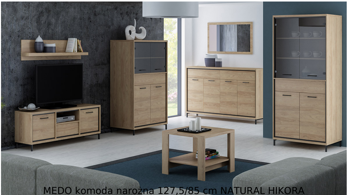
MEDO komoda narożna 127,5/85 cm NATURAL HIKORA

Prosta i funkcjonalna komoda narożna o szerokości 127,5/81 cm należąca do systemu MEDO. Możliwość dokupienia oświetlenia LED pod blat. Jasny kolor natural hikora dodaje ciepłego charakteru. Meble wykonane z wysokiej jakości płyty laminowanej o grubości 16mm, blaty pogrubione do 32mm. Obrzeża wykończone trwałą okleiną PCV. System posiada ramkę ozdobną w kolorze czarnym z MDF oraz system cichego domykania. Szuflady na prowadnicach kulkowych z pełnym wysuwem oraz funkcją "push to open". Całość zdobią metalowe uchwyty. Meble pakowane w paczki, do samodzielnego montażu. Do kompletu dołączona przejrzysta instrukcja montażu. Produkt w 100% polski.