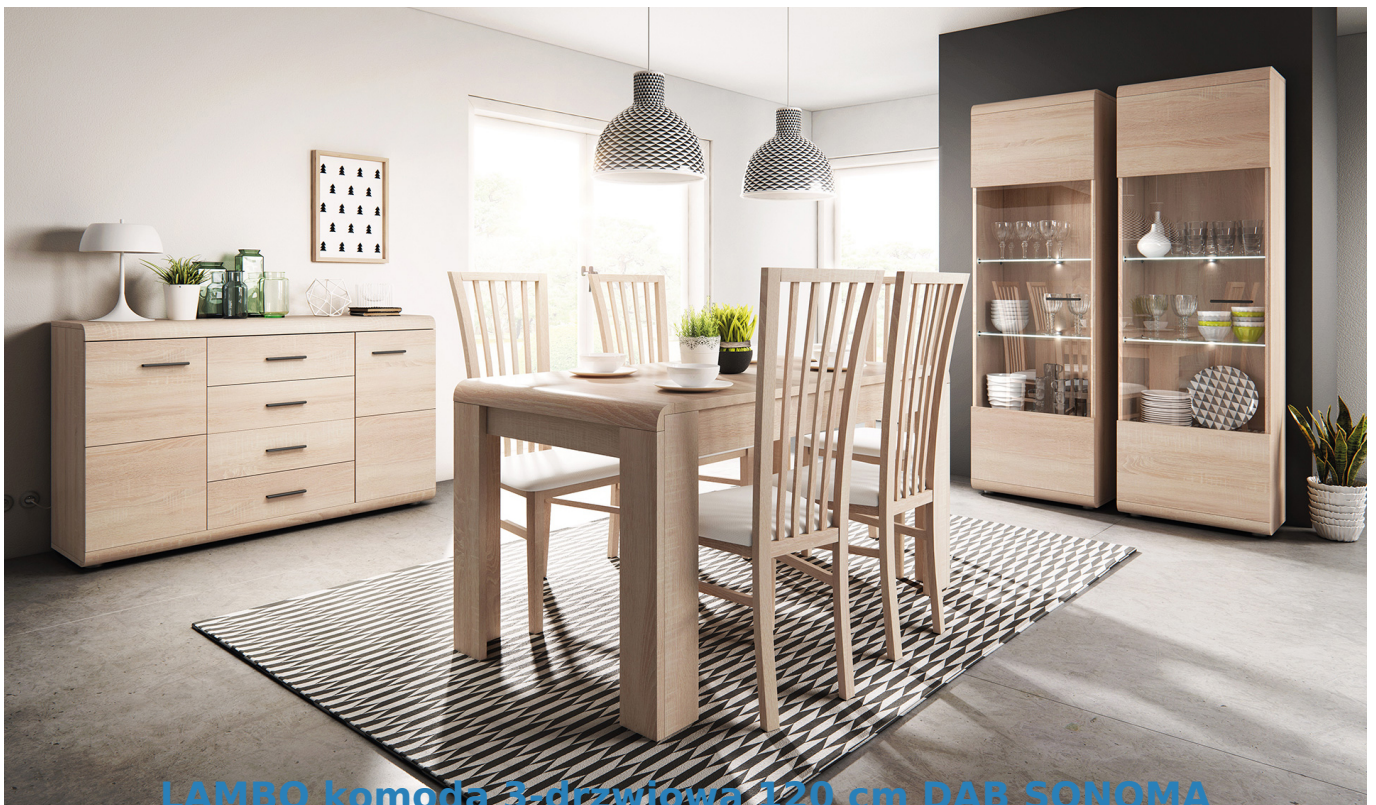
LAMBO komoda 3-drzwiowa 120 cm DĄB SONOMA

Nowoczesna komoda trzydrzwiowa z witryną, wyposażona w półki należące do systemu LAMBO. Możliwość zakupu komody z oświetleniem LED - zakładka "akcesoria" . System meblowy zainspirowany pięknem, siłą i szlachetnością starego dębu. Smaku kolekcji dodają zaoblone kształty brył oraz charakterystyczne frezowane fronty. Meble wykonane z wysokiej jakości płyty, listwy z płyty MDF, korpus oklejony obrzeżem ABS. Meble pakowane w paczki, do samodzielnego montażu. Do kompletu dołączona przejrzysta instrukcja montażu. Produkt w 100% polski.