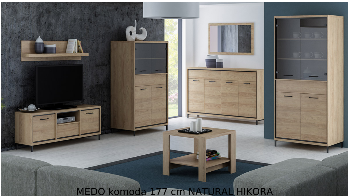
MEDO komoda 177 cm NATURAL HIKORA

Prosta i funkcjonalna komoda z półkami oraz szufladami o szerokości 177 cm należąca do systemu MEDO. Możliwość dokupienia oświetlenia LED pod blat. Jasny kolor natural hickora dodaje ciepłego charakteru. Meble wykonane z wysokiej jakości płyty laminowanej o grubości 16mm, blaty pogrubione do 32mm. Obrzeża wykończone trwałą okleiną PCV. System posiada ramkę ozdobną w kolorze czarnym z MDF oraz system cichego domykania. Szuflady na prowadnicach kulkowych z pełnym wysuwem oraz funkcją "push to open". Całość zdobią metalowe uchwyty. Meble pakowane w paczki, do samodzielnego montażu. Do kompletu dołączona przejrzysta instrukcja montażu. Produkt w 100% polski.