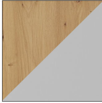
ARTISAN / JASNY SZARY