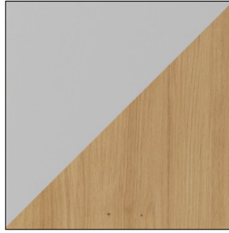
JASNY SZARY / ARTISAN