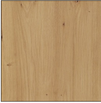
ARTISAN / ARTISAN