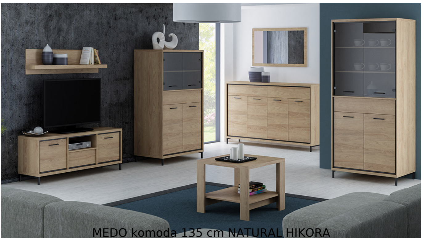
MEDO komoda 135 cm NATURAL HIKORA

Prosta i funkcjonalna komoda z półkami oraz szufladami o szerokości 135 cm należąca do systemu MEDO. Możliwość dokupienia oświetlenia LED pod blat. Jasny kolor natural hickora dodaje ciepłego charakteru. Meble wykonane z wysokiej jakości płyty laminowanej o grubości 16mm, blaty pogrubione do 32mm. Obrzeża wykończone trwałą okleiną PCV. System posiada ramkę ozdobną w kolorze czarnym z MDF oraz system cichego domykania. Szuflady na prowadnicach kulkowych z pełnym wysuwem oraz funkcją "push to open". Całość zdobią metalowe uchwyty. Meble pakowane w paczki, do samodzielnego montażu. Do kompletu dołączona przejrzysta instrukcja montażu. Produkt w 100% polski.