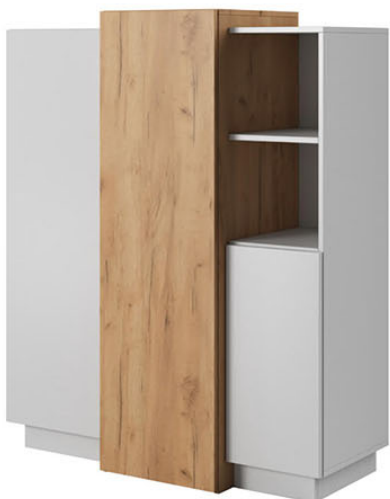
Komoda 3d szer. 110 / wys. 133,5 / gł. 45 cm