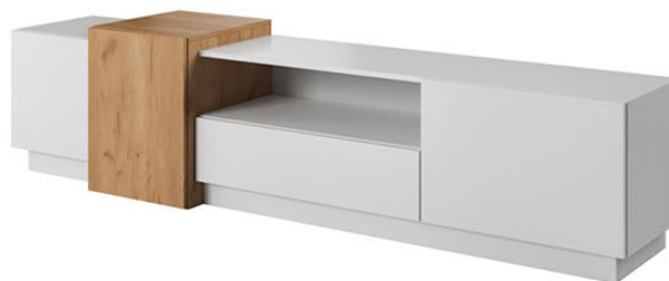
Stolik rtv - szer. 220 / wys. 53,5 / gł. 45 cm Półka wisząca - szer. 140 / wys. 33,2 / gł. 31,6 cm Szafka wisząca 1 - szer. 40 / wys. 93 / gł. 36,6 cm Szafka wisząca 2 - szer. 40 / wys. 83 / gł. 31,6 cm