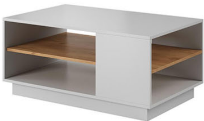
Stolik kawowy szer. 100 / wys. 45,5 / gł. 60 cm