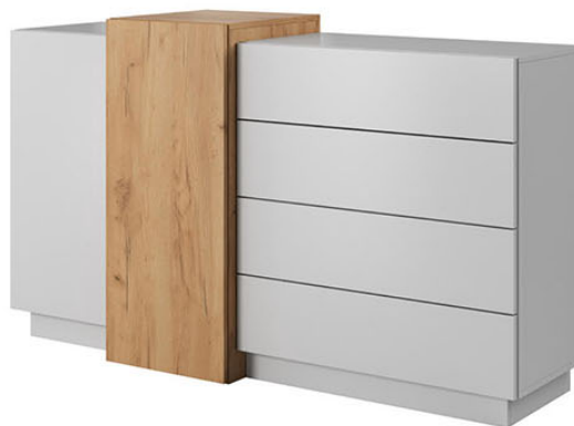
Komoda 2d4s szer. 160 / wys. 93,5 / gł. 45 cm