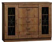
T14 140x44x110 cm opcja pełny front