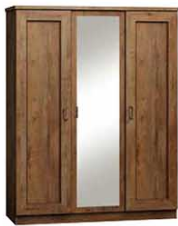
T15 135x57x190 cm