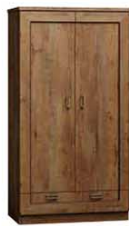
T7 90x57x190 cm opcja trzech półek