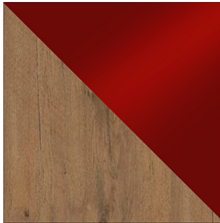
DĄB LANCELOT / BORDO POŁYSK