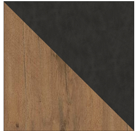
DĄB LANCELOT / MATERA