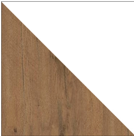
DĄB LANCELOT / BIAŁY POŁYSK