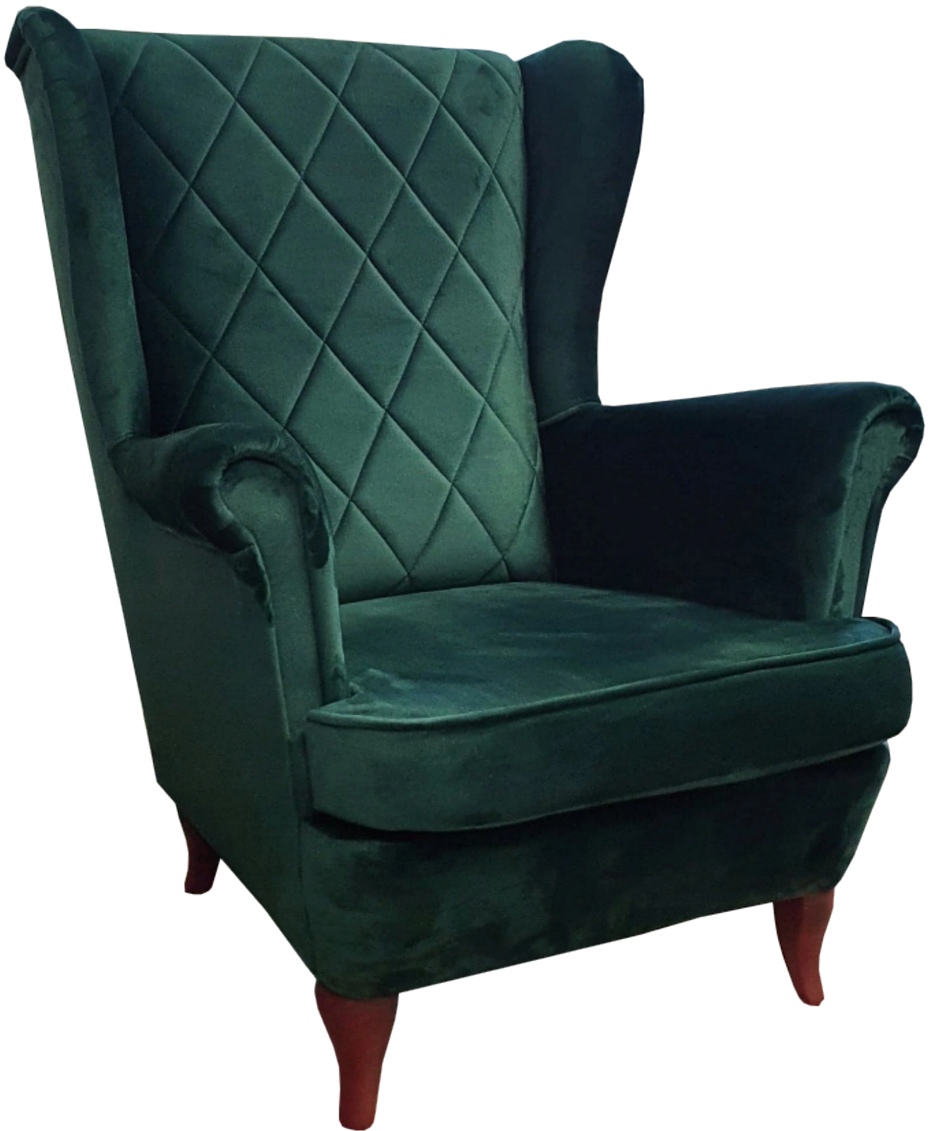
DARNI 14 fotel uszak