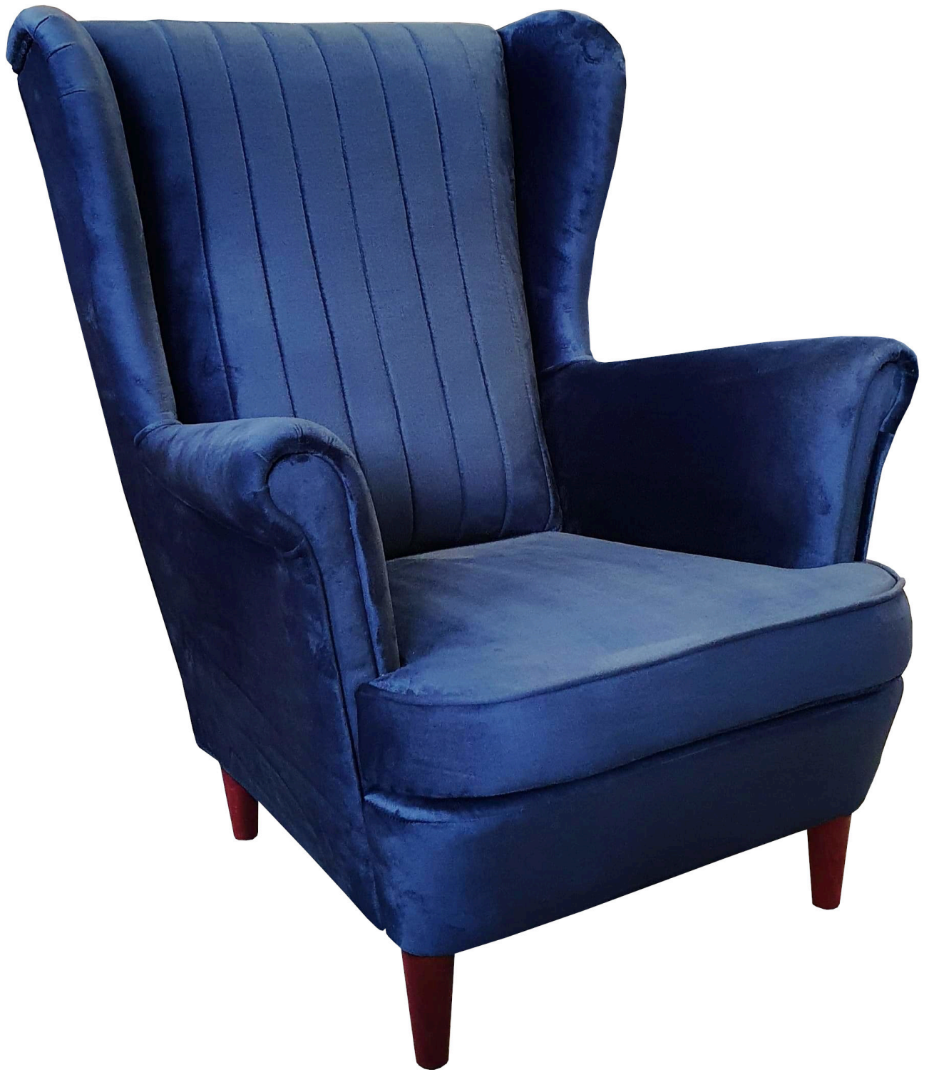
DARNI 13 fotel uszak