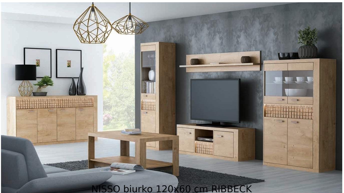
NISSO biurko 120x60 cm RIBBECK

Biurko z 4 szufladami o wymiarach 120x60 cm należące do systemu NISSO. Ultranowoczesny wygląd stworzonej kolekcji, to pomysł zarówno na salon jak i sypialnię. Połączenie prostoty kształtów oraz artystycznego akcentu dla lubiących bardzo innowacyjny wygląd w zestawieniu z praktycznością. Fronty szuflad dostępne w stylu NATURAL KRATKA lub NATURAL FALA. Meble pakowane w paczki, do samodzielnego montażu. Do kompletu dołączona przejrzysta instrukcja montażu. Produkt w 100% polski.