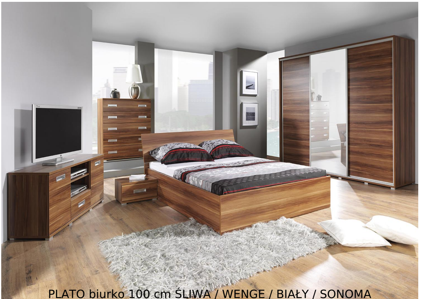
PLATO biurko 100 cm ŚLIWA / WENGE / BIAŁY / SONOMA